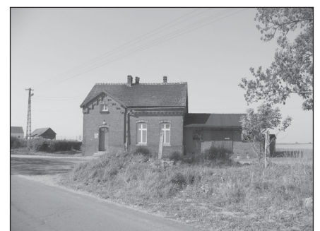
Stacja kolejowa w Ruścu